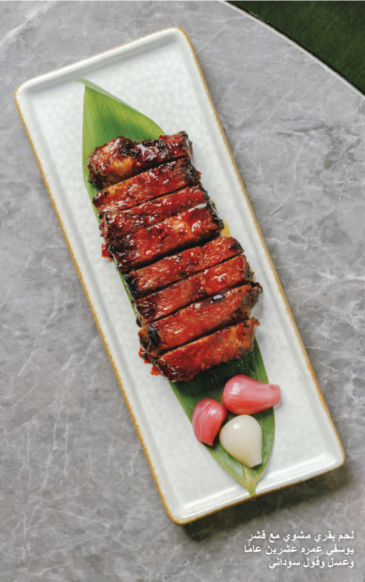
لحم بقري مشوي مع قشر يوسف عمره عشرين عاماً وعسل وفول سوداني

Shop 3101, Podium Level 3, IFC mall, Central ☎