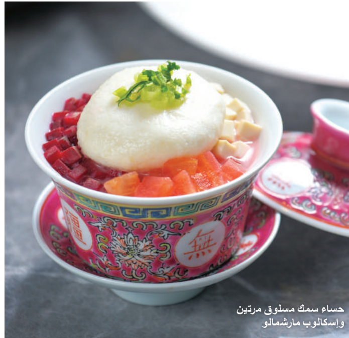
حساء سمك مسلوق مرتين وإسكالوب مارشمالو

مطعم Chinesology هو الخيار الأنسب لتجربة تناول طعام حلال مُرضية للحواس.