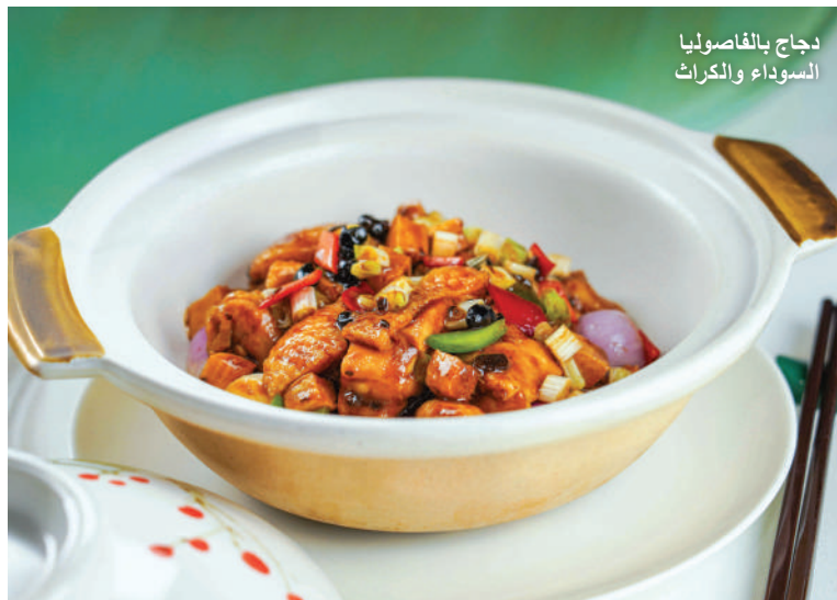
دجاج بالفاصوليا السوداء والكراث

https://www.fullertonhotels.com/fullerton-ocean-park-hotel-hongkong/dining/restaurants-and-bars/jade