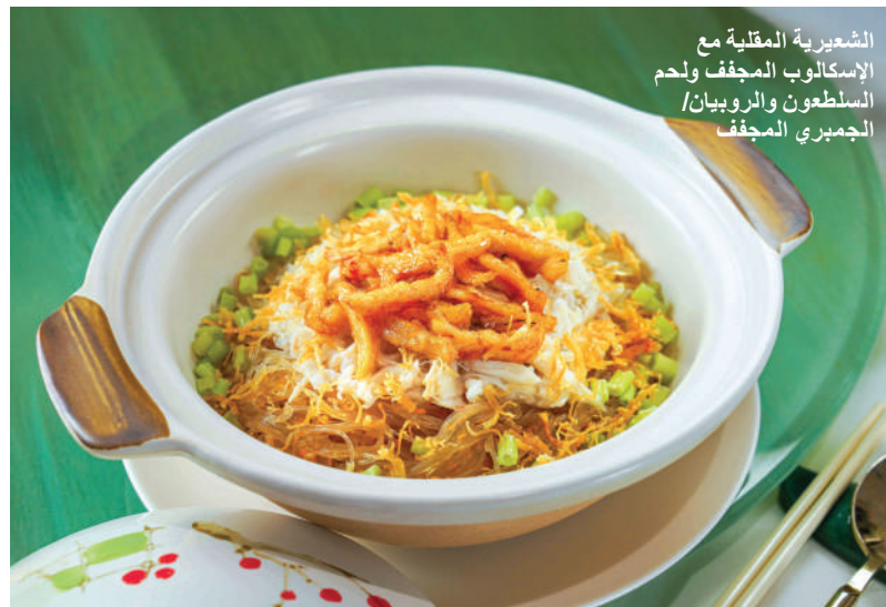
الشعبيرية المقلية مع الإسكالوب المجفف ولحم السلطعون والروبيان/ الجمبري المجفف