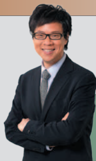
Stephen Chan 陳志雲

Commissioner for Tourism Commerce and Economic Development Bureau The Government of the Hong Kong SAR 香港特別行政區政府商務及經濟發展局 旅遊事務專員