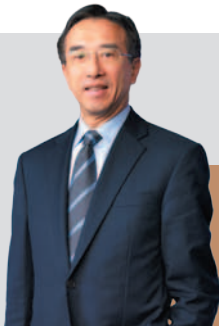
James Tien GBS JP 田北俊 CHAIRMAN 主席

Chairman Manhattan Holdings Limited 萬泰控股有限公司 主席