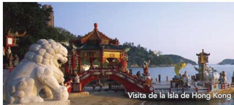
Visita de la Isla de Hong Kong