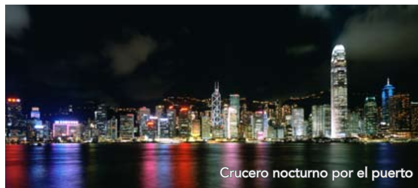
Crucero nocturno por el puerto