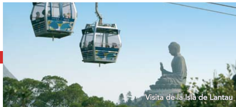
Visita de la Isla de Lantau

Si durante su viaje tiene pensado visitar las islas, no se pierda el monasterio de Po Lin, donde podrá contemplar de cerca la estatua de bronce de un Buda sentado al aire libre más grande del mundo. Otras atracciones de interés son el teleférico aéreo Ngong Ping 360, desde el cual podrá disfrutar de unas maravillosas vistas panorámicas de la isla, o Hong Kong Disneyland, un lugar ideal para visitar con la familia.