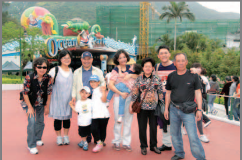
暢玩世界一流的水族及主題公園——海洋公園也是大受歡迎的項目。