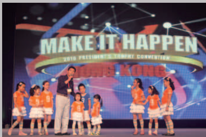
兒童也獲邀登臺分享快樂。