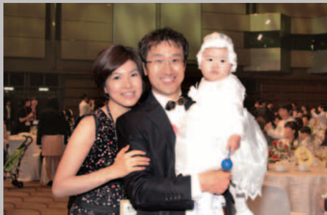
有機會攜同配偶和孩子享受精彩香港遊，確是一種能真正激勵員工的好辦法。