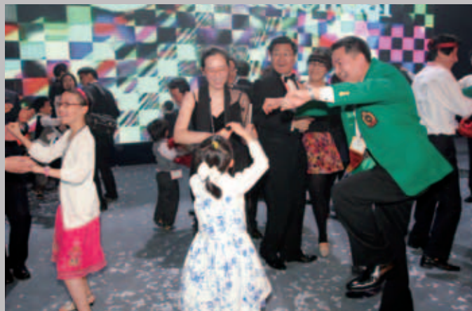
在舞池裏，各年齡層的參加者盡情分享他們的激動和幸福。