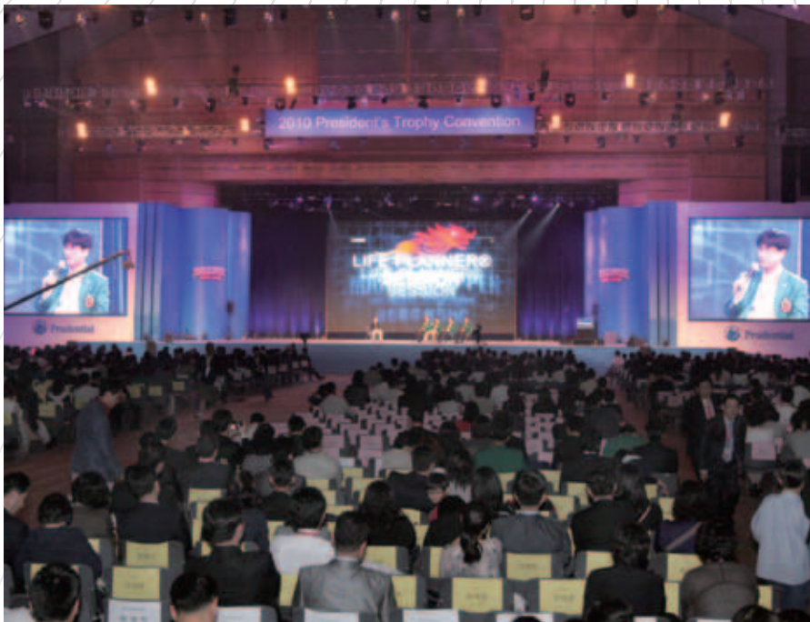
激勵分享會在設備最先進的香港會議展覽中心舉行。