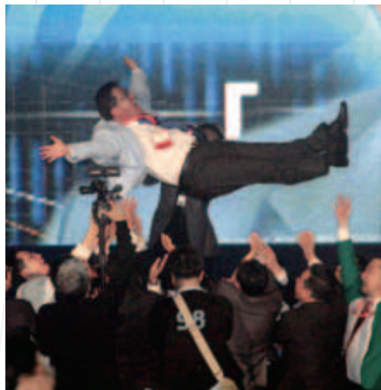
與會者為最佳業績得主熱烈喝彩。

秦先生說：「算上我的私人旅行，這還是我第一次到香港，看到東西方文化以現代方式融為一體，實在奇妙。」