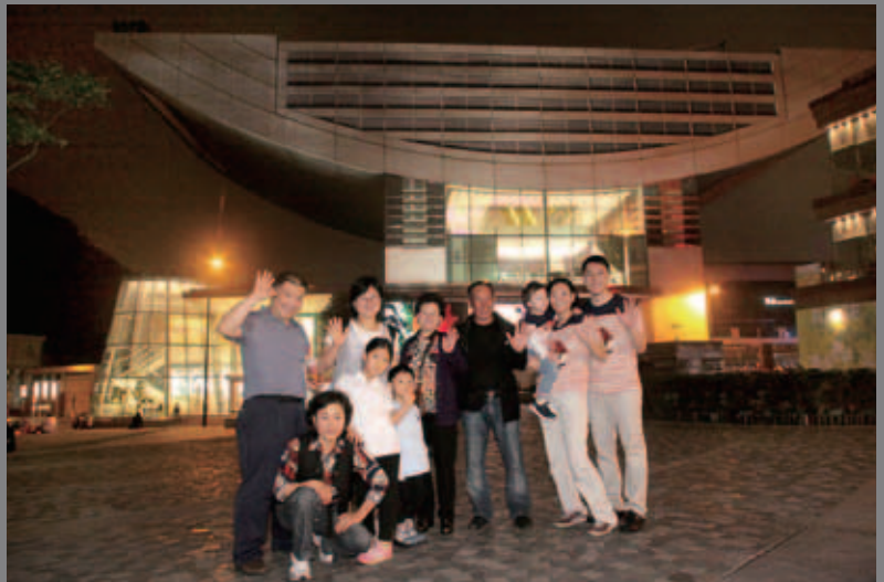
香港多個老少咸宜的景點深受各個家庭的喜愛，遊人必到的太平山頂豈容錯過！