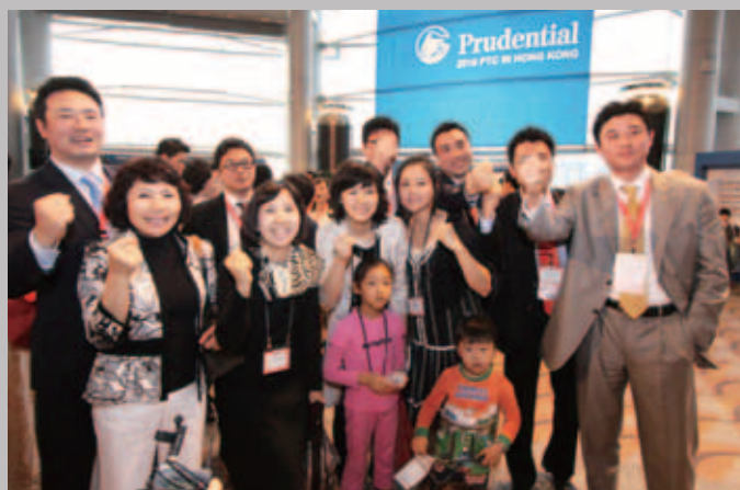
獲得獎勵旅遊的員工對於有機會攜眷遊香江而深感自豪。