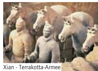
Xian - Terrakotta-Armee