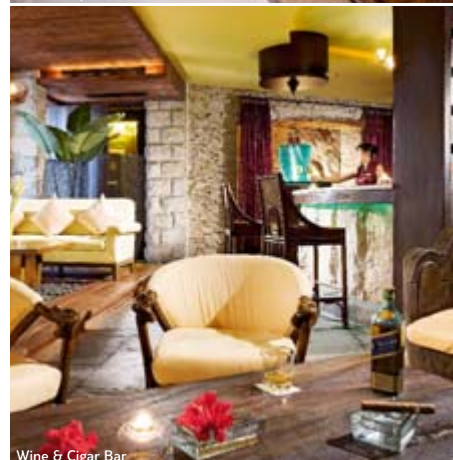
Wine & Cigar Bar