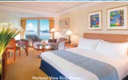
Harbour View King Room

Das bietet Ihre Unterkunft: Das First-Class Hotel verfügt über alle Einrichtungen, die Sie von einem Hotel dieser Klasse erwarten. In 7 Restaurants werden Ihnen Köstlichkeiten aus aller Welt serviert. Zu den weiteren Annehmlichkeiten gehören ein Cafe, Lounge, Business Center und Geschäfte. Spa-Bereich, Pool mit Terrasse auf dem Dach des Hotels und voll ausgestattetes Fitnesscenter im 21. Stock. Kreditkarten: World of TUI Card, VI, MC, AX, DI und JCB.