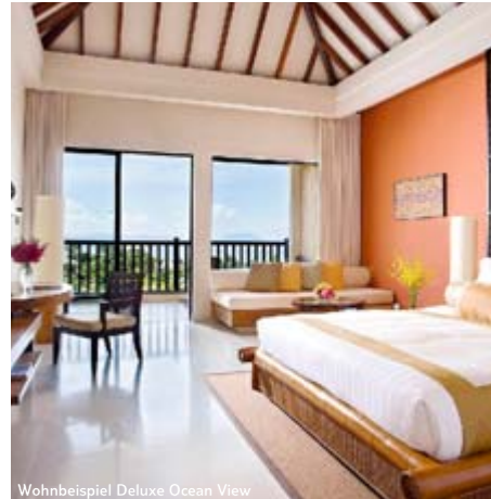
Wohnbeispiel Deluxe Ocean View