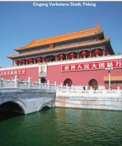
Eingang Verbotene Stadt, Peking

Hinweis: Änderungen der Route und der Hotels vorbehalten. Verpflegungsleistung: F=Frühstück, M=Mittagessen, A=Abendessen.