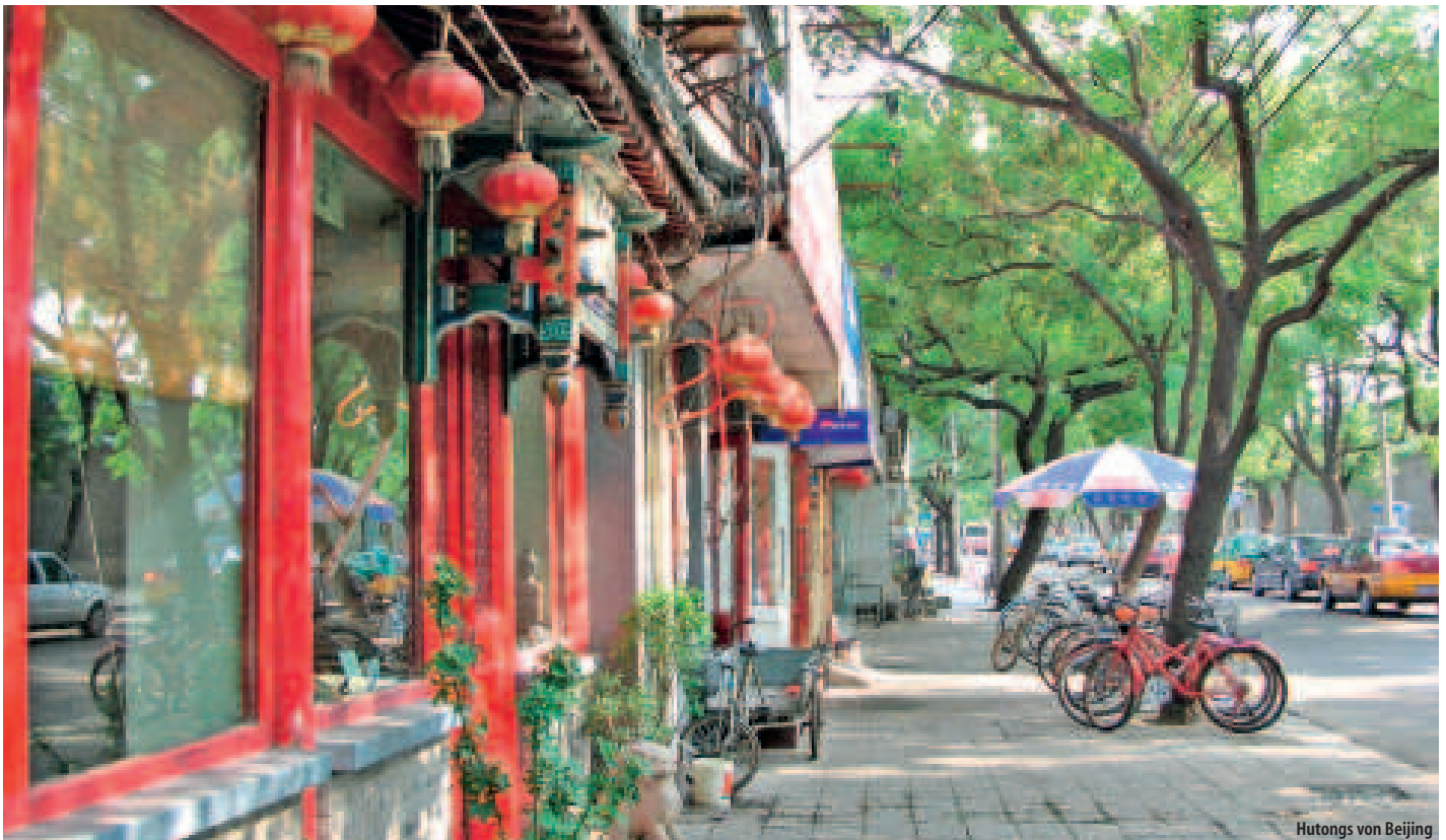
Hutongs von Beijing

China inklusive Hongkong Garantierte Abfahrt am 13.06. und 05.09.