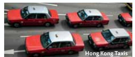
Hong Kong Taxis

Details zu Preisen und Leistungen finden Sie auf Seite 8 der Preisliste. Code: RBS3b