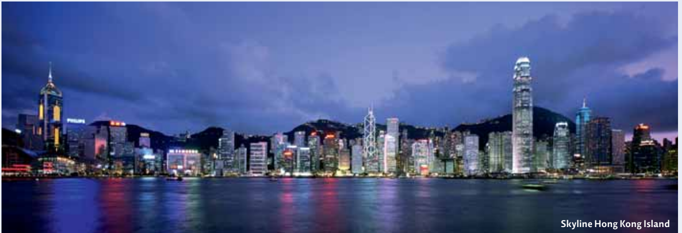
Skyline Hong Kong Island