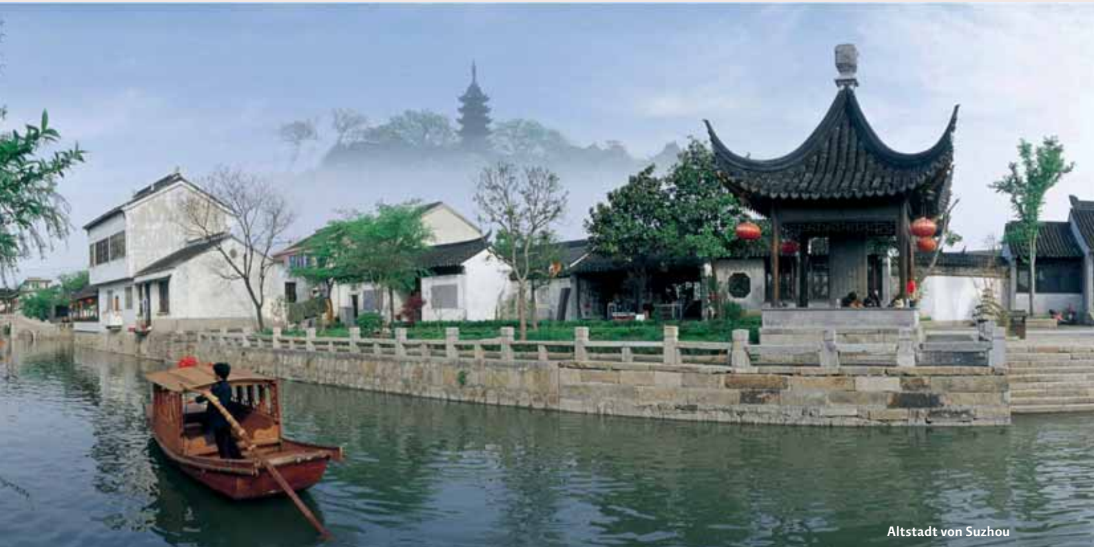
Altstadt von Suzhou

Shanghai · Suzhou · Zhouzhuang · Hangzhou · Peking · Xi'an · Chengdu Leshan · Emeishan · Huanglong · Jiuzhaigou · Guilin · Yangshuo · Hong Kong