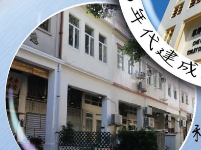
充满建筑特色 和历史气息的新樓街