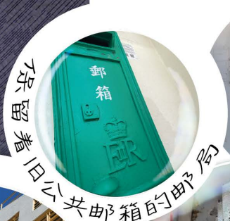
保留着旧公共邮箱的邮局