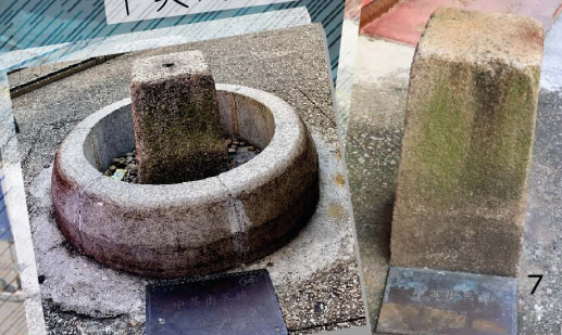
中英街3号及5号界石