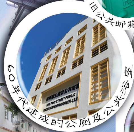
60年代建成的公厕及公共浴室