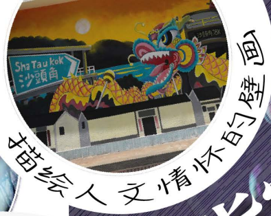
描绘人文情怀的壁画